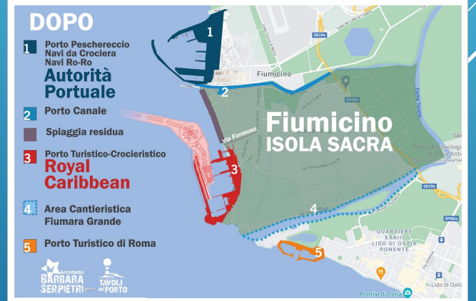
L'immagine mostra l'attuale foce e come potrebbe diventare se i due mega porti venissero realizzati